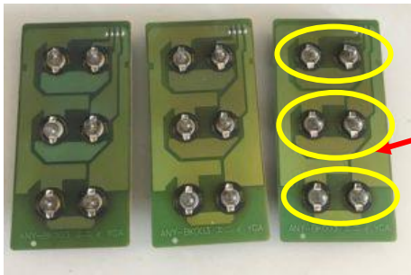
←既存のリールランプ基板 (ウェッチベース電球)

⚠️ まず購入前にご確認ください (リール上基板が不良の場合は交換しても点灯しません)